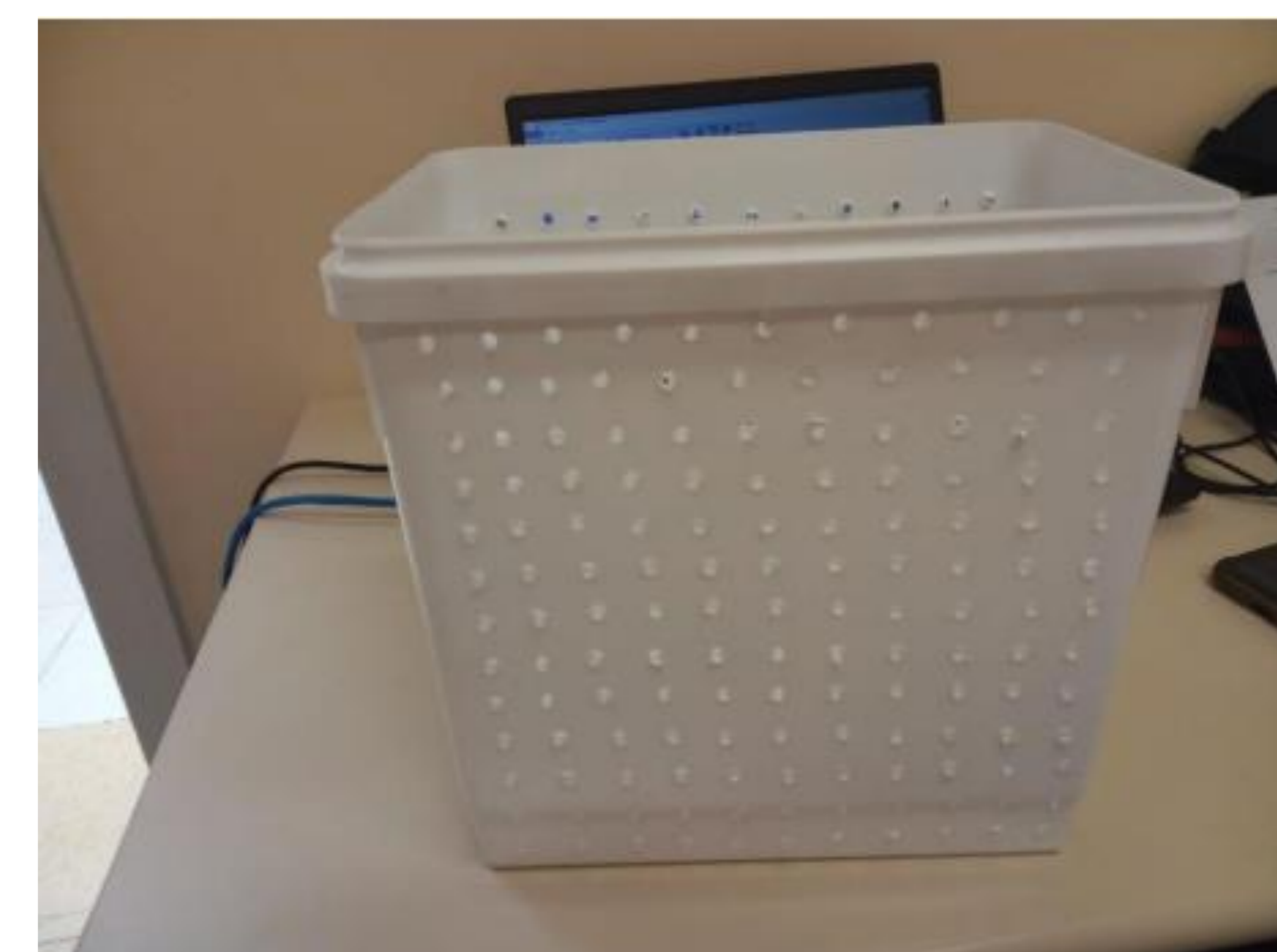
Figura 1- Cesto coletor do projeto

Com o protótipo parcialmente finalizado, iremos começar a finalização do circuito elétrico e programação, em seguida iremos iniciar testes envolvendo o protótipo em situações reais, simulações no Tinkercad antes de iniciarmos os testes em bancada e o encapsulamento do circuito elétrico para o proteger da água que entra constantemente no cesto coletor.